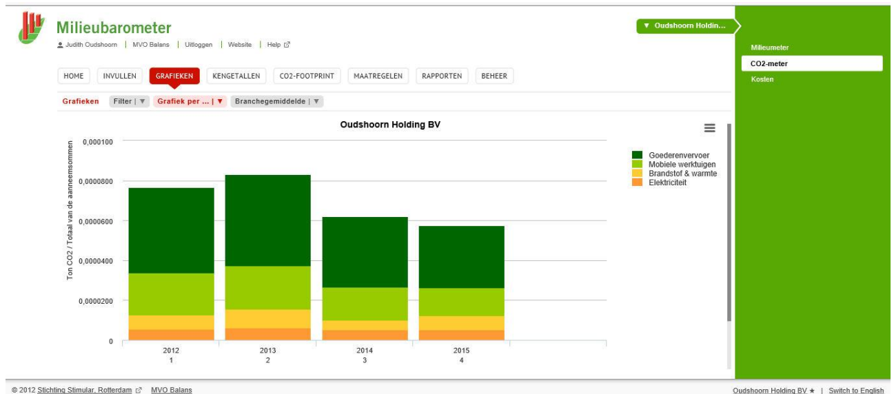
Fig. 2 Absolute CO2 factor versus jaaromzet